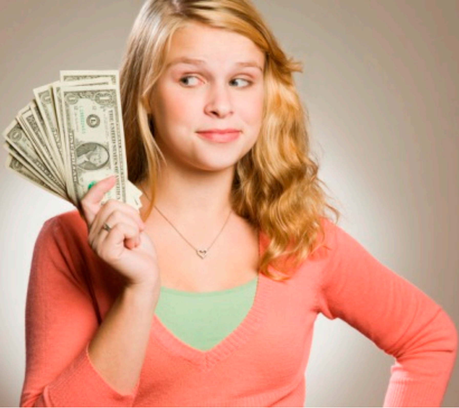
Debata dotycząca tego, czy płacić dzieciom za wykonywanie określonych prac, wciąż powraca